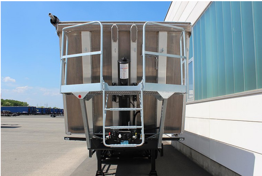
Podest stojący na ścianie przedniej do obsługi plandeki rolkowej