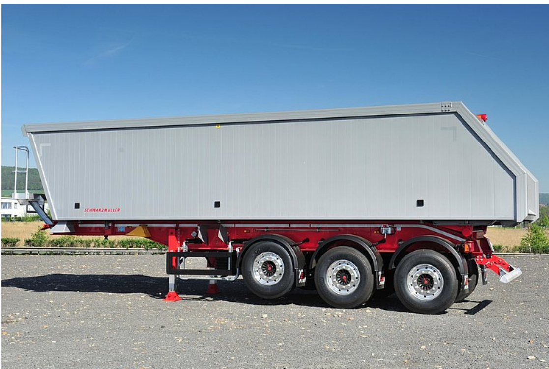
3-osiowa naczepa siodłowa wywrotka w całości aluminiowa ze skrzynią z profili zamkniętych