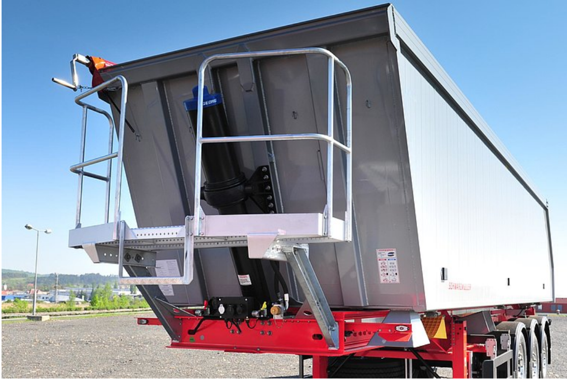
Optymalny rozkład obciążenia dzięki pochyłej ścianie przedniej