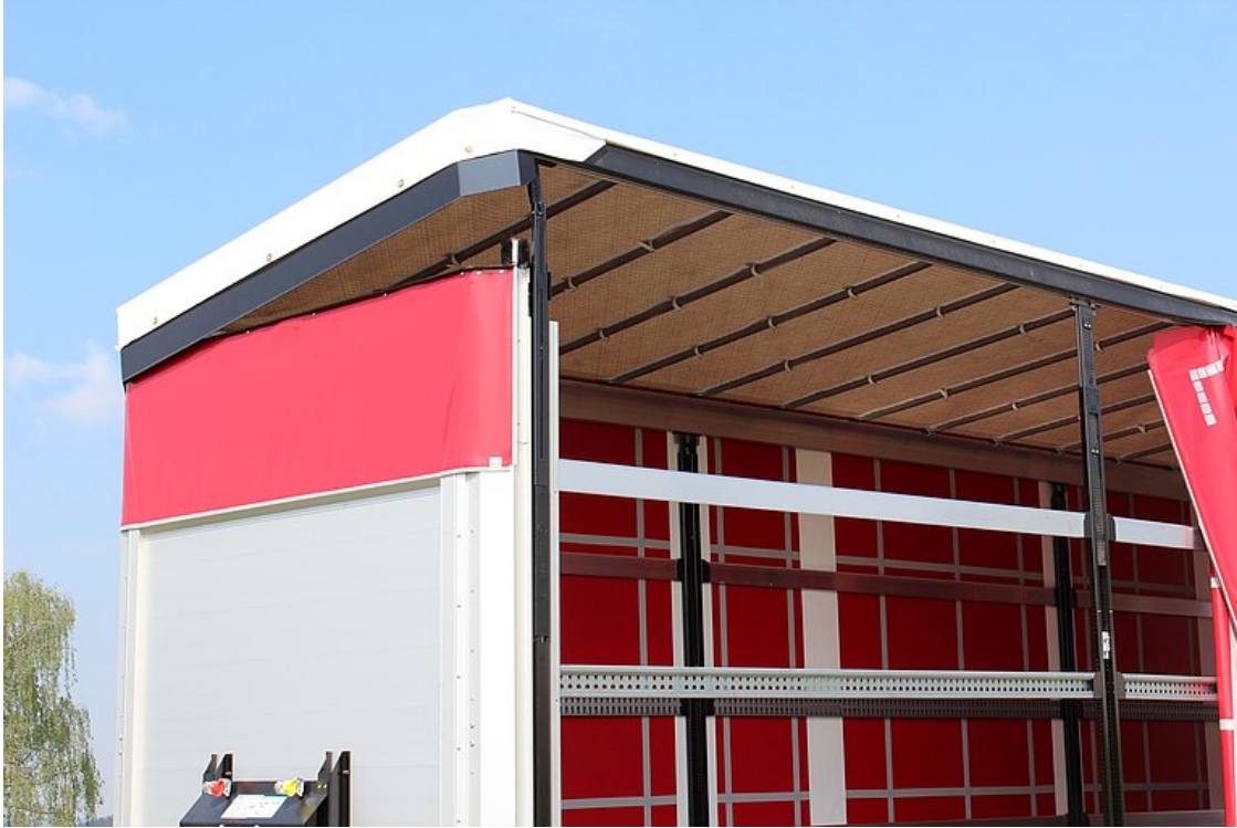
OPCIONÁLIS: kézi hidraulikus tetőemelő, mely a gyors be- és kirakodáshoz 400 mm emelést tesz lehetővé