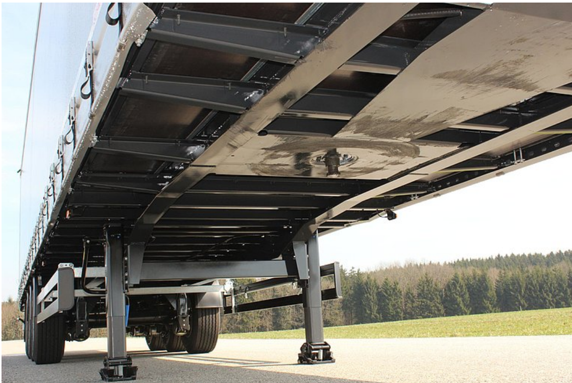
Csavarodásálló hegesztett létra-alváz acélkonstrukció