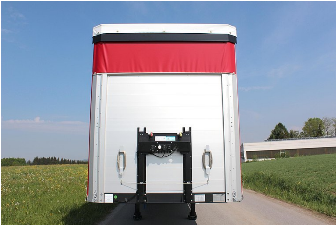
Erősített, üreges alumínium profil mellfal, aljzattartóval