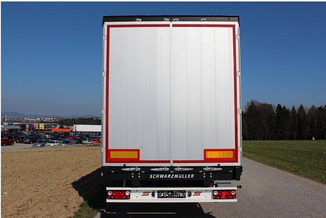
27 mm-es rétegelt falemez egybefuttatva az alváz keretszegélyével és 2 acél kalapprofil a hossztartók fölött (7 tonna targoncatengely-terhelés.)