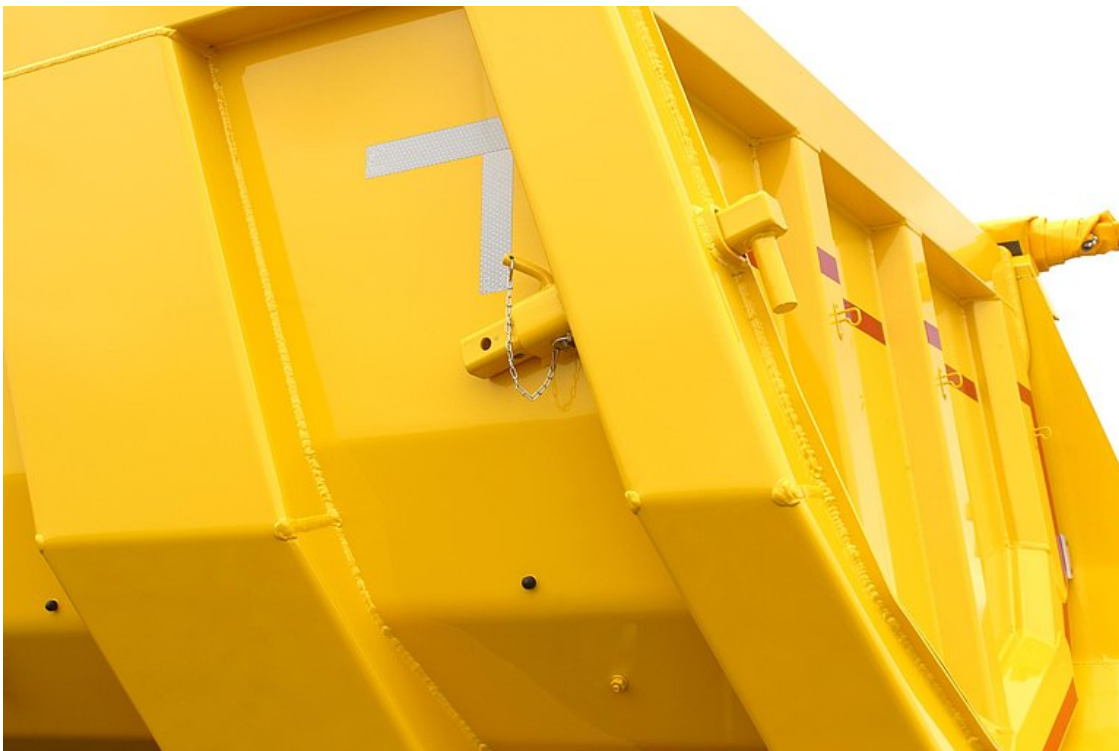
OPCIONÁLIS: adagolórendszer kibillenő hátfalhoz, kihúzható ütközővel