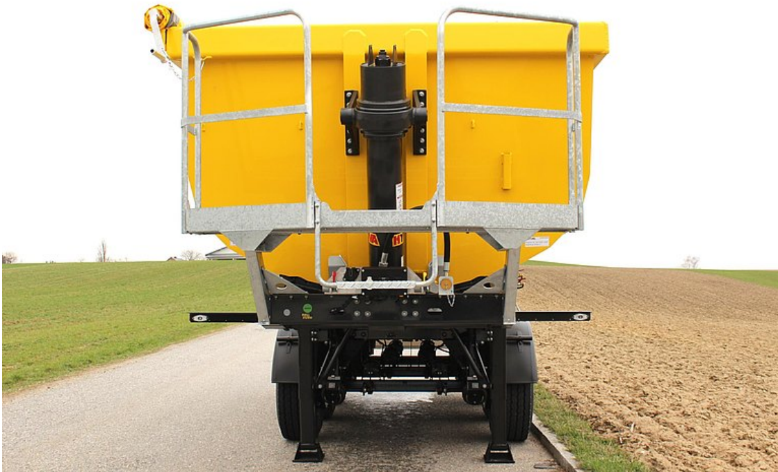
Kezelőkarzat a mellfalon a ponyva kezeléséhez