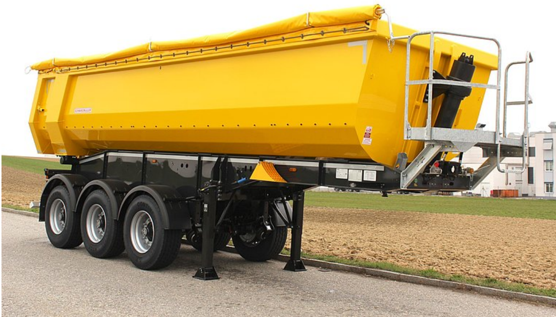
3-tengelyes, hátrabilenő félpótkocsi, szegmentívű alumínium puttonnyal