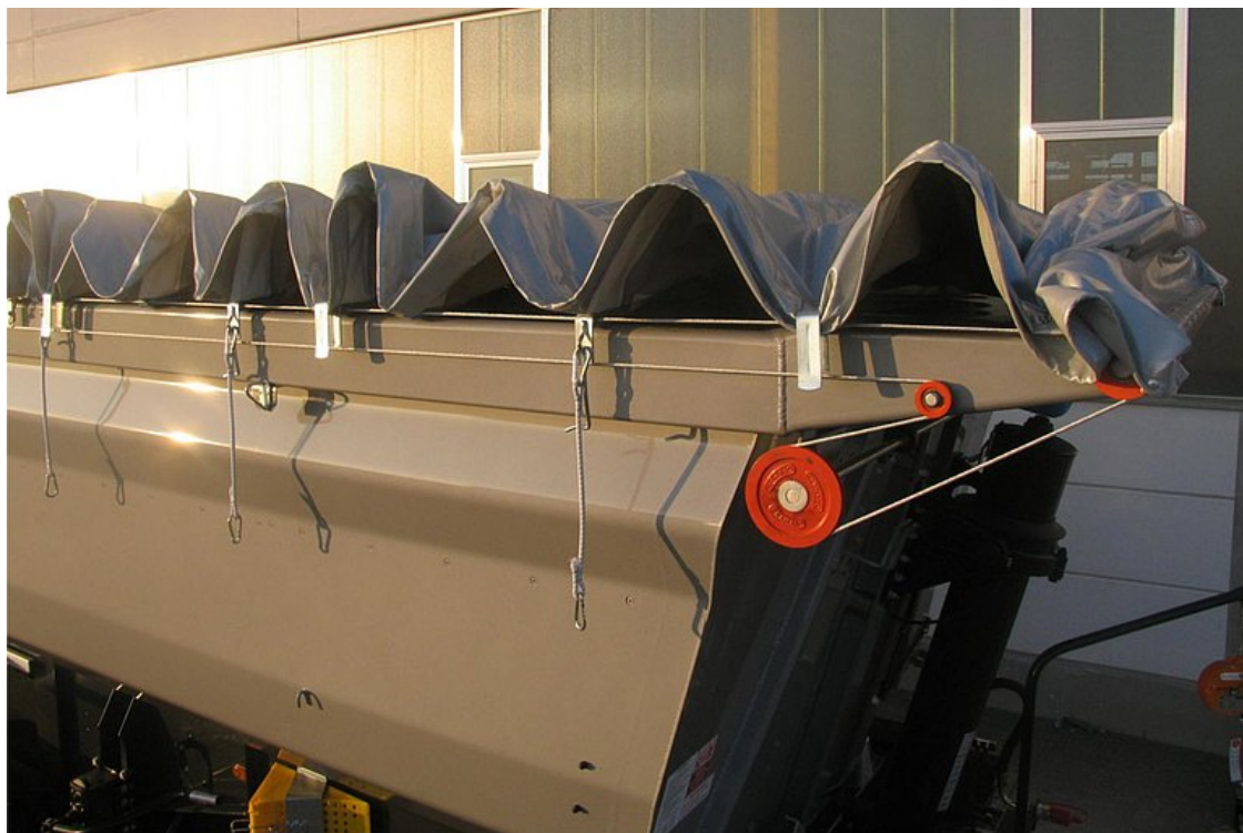
OPCIONÁLIS: rolós tetőszerkezet - manuális vagy elektromos távvezérléssel kezelhető