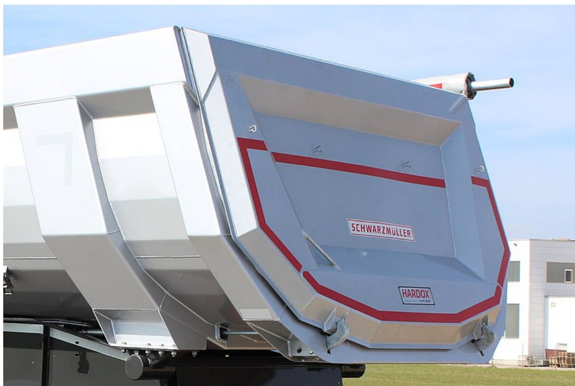
OPCIONÁLIS: kívülre záródó hátfal - biztosítva a nagyobb térfogatot