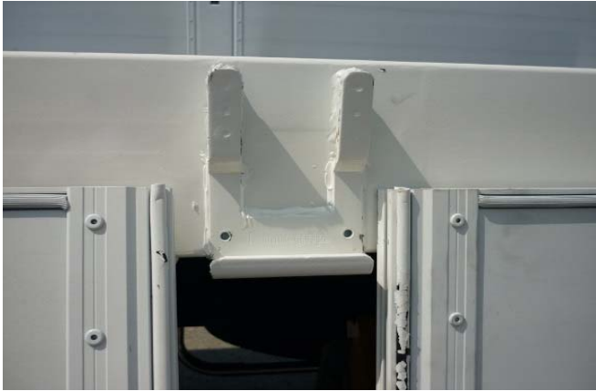
Rungenlager: Schweißnähte auf Risse prüfen