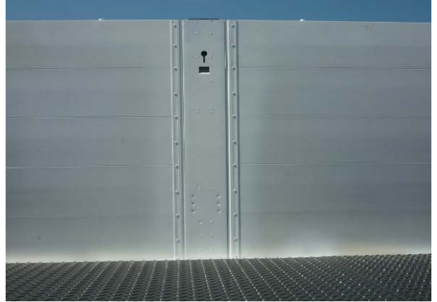
Bordwände: Vernietung auf Festsitz prüfen