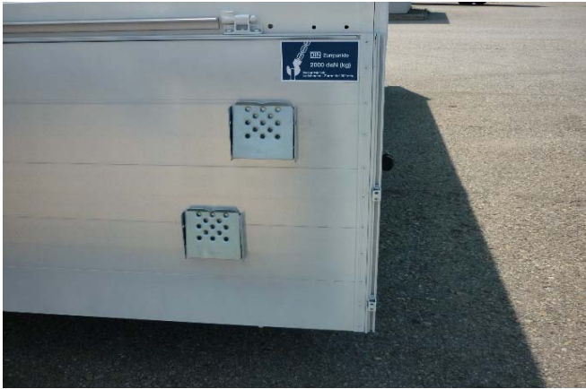
Rückwand: Vernietung auf Festsitz prüfen