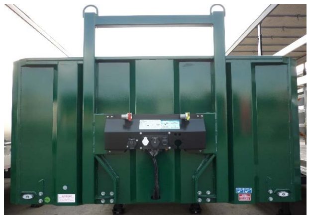
Verschraubungen auf Festsitz prüfen Schweißnähte auf Risse prüfen