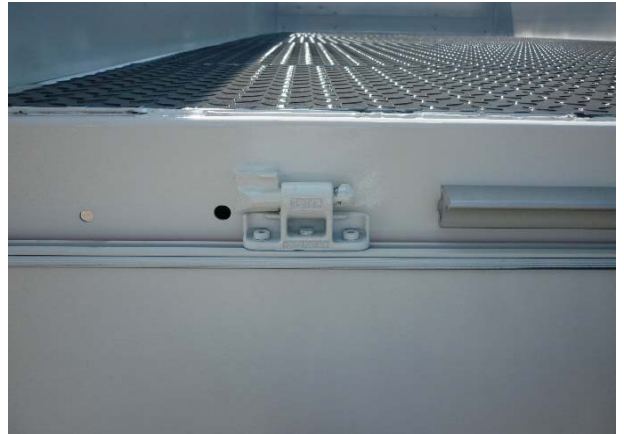
Scharnierkegel: Schweißnähte auf Risse prüfen