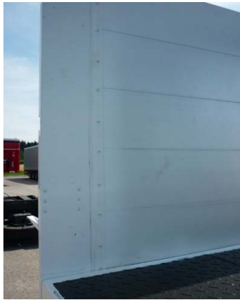
Bordwände: Vernietung auf Festsitz prüfen