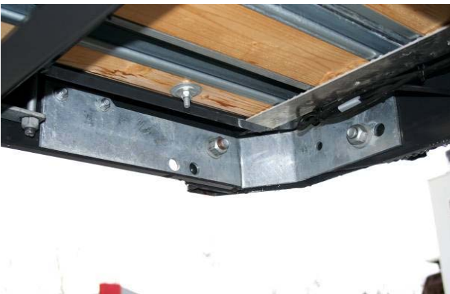
Verschraubung Ecksäule innen auf Festsitz prüfen