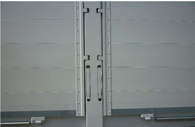
Mittel-, Ecksäule vorne und hinten auf Funktion der Verriegelungen prüfen