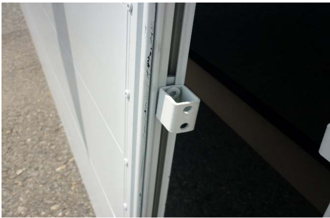
Gegenhalter auf Festsitz und Beschädigung prüfen