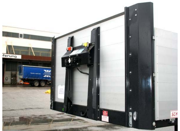
Gerätehalter: Alle Nieten und Schrauben auf Festsitz prüfen