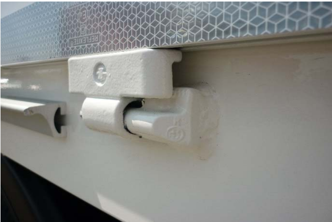
Scharnierkegel: Schweißnähte auf Risse prüfen