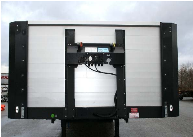
Alle Nieten und Schrauben auf Festsitz prüfen