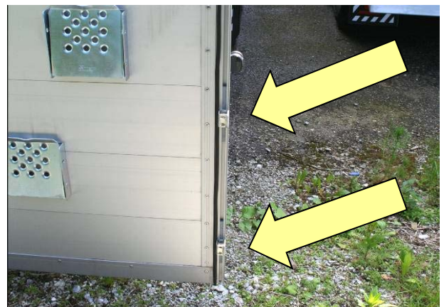
Gegenhalter an beiden Fahrzeugseiten auf Festsitz prüfen