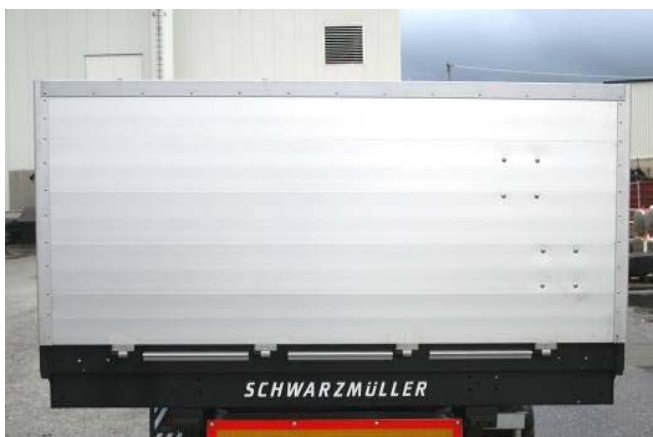
Rückwand: Vernietung auf Festsitz prüfen