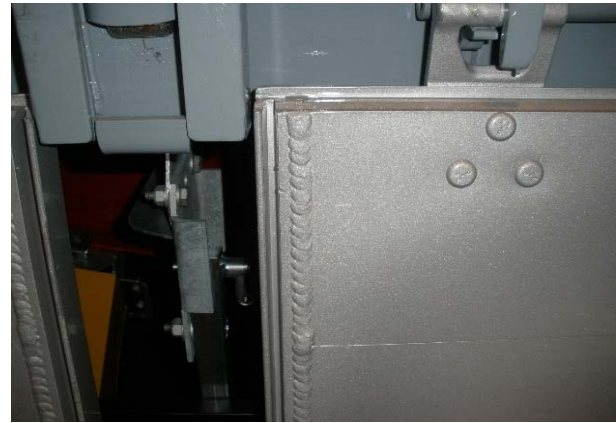
Bordwände: Schweißnähte auf Risse prüfen