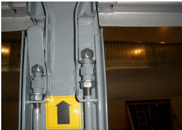
Verriegelung Pendelbolzen auf Spiel und Funktion