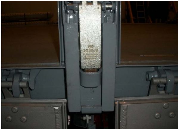
Rungenlager: Schweißnähte auf Risse prüfen, bewegliche Teile auf Verschleiß prüfen