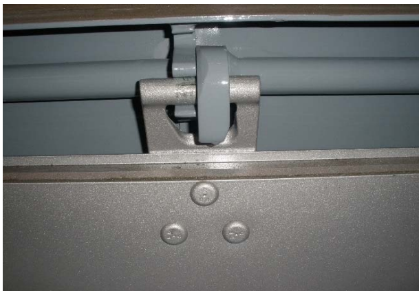
Zentralverriegelung: Sichtprüfung auf Abnutzung, Spiel etc.