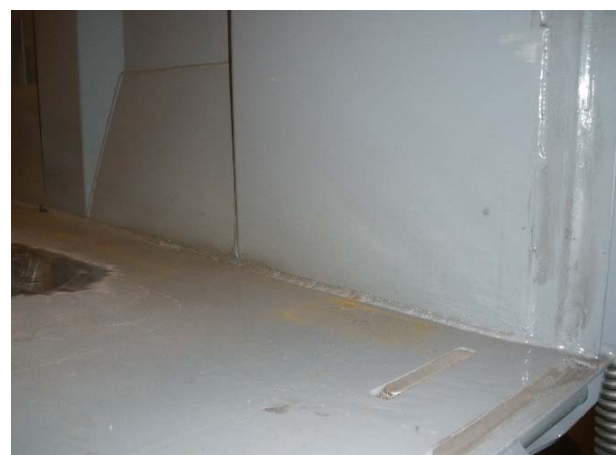
Schweißnähte Innenseite auf Risse prüfen