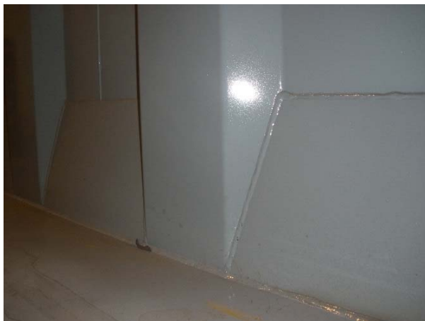
Schweißnähte Versteifungen Innenseite