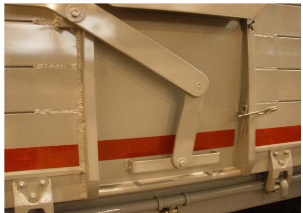
Rückwand: Schweißnähte auf Risse prüfen