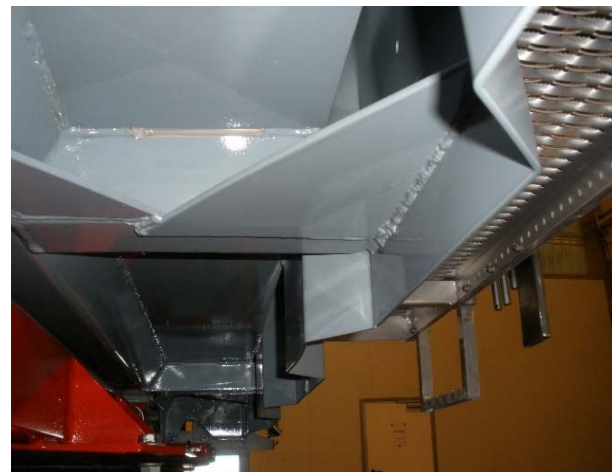
Schweißnähte auf Risse prüfen