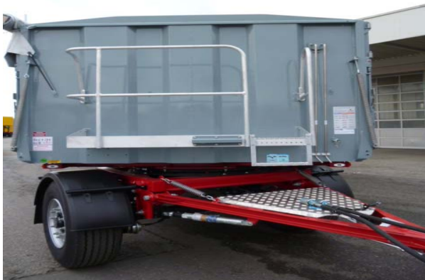
Schweißnähte auf Risse prüfen