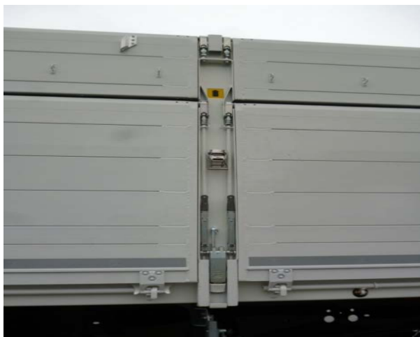
Vorderwand, Mittelsäule(n) und Ecksäule hinten auf Funktion der Verriegelungen prüfen