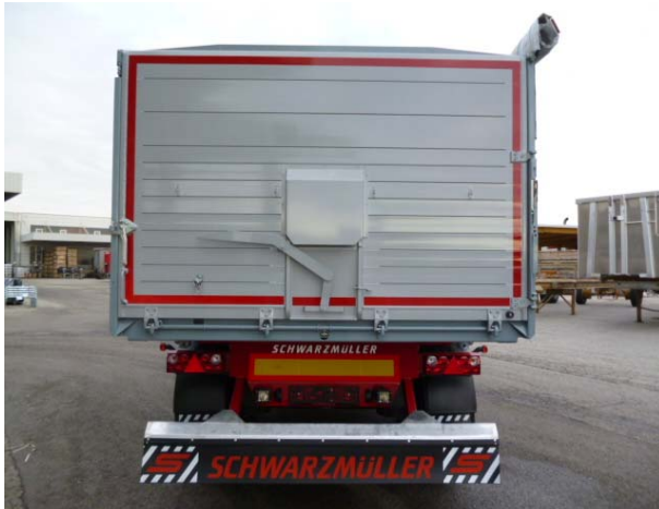
Rückwand: Schweißnähte auf Risse prüfen