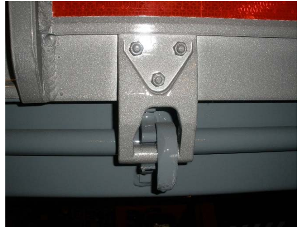
Scharniere: Schweißnähte auf Risse, Verschraubung auf Festsitz prüfen