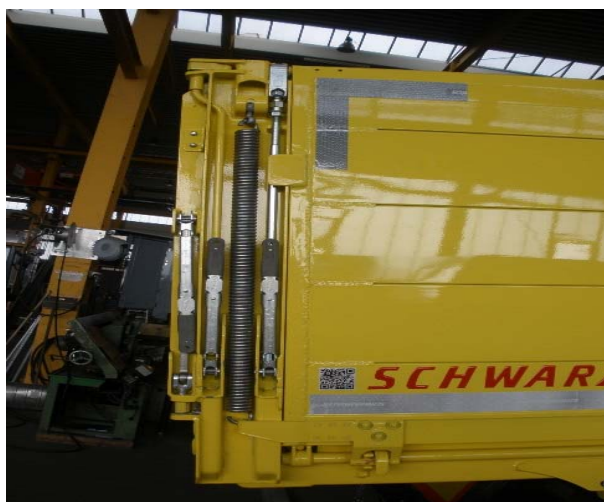
Rückwand zusätzlich schwenkbar: Sämtliche bewegliche Anbauteile wie Scharniere, Verschlüsse, Bolzen, Zapfen etc. auf Verschleiß und Funktion prüfen