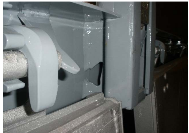
Rungenlager: Schweißnähte auf Risse prüfen