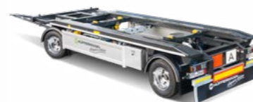
Görgős- ill. láncos konténer szállító járművek