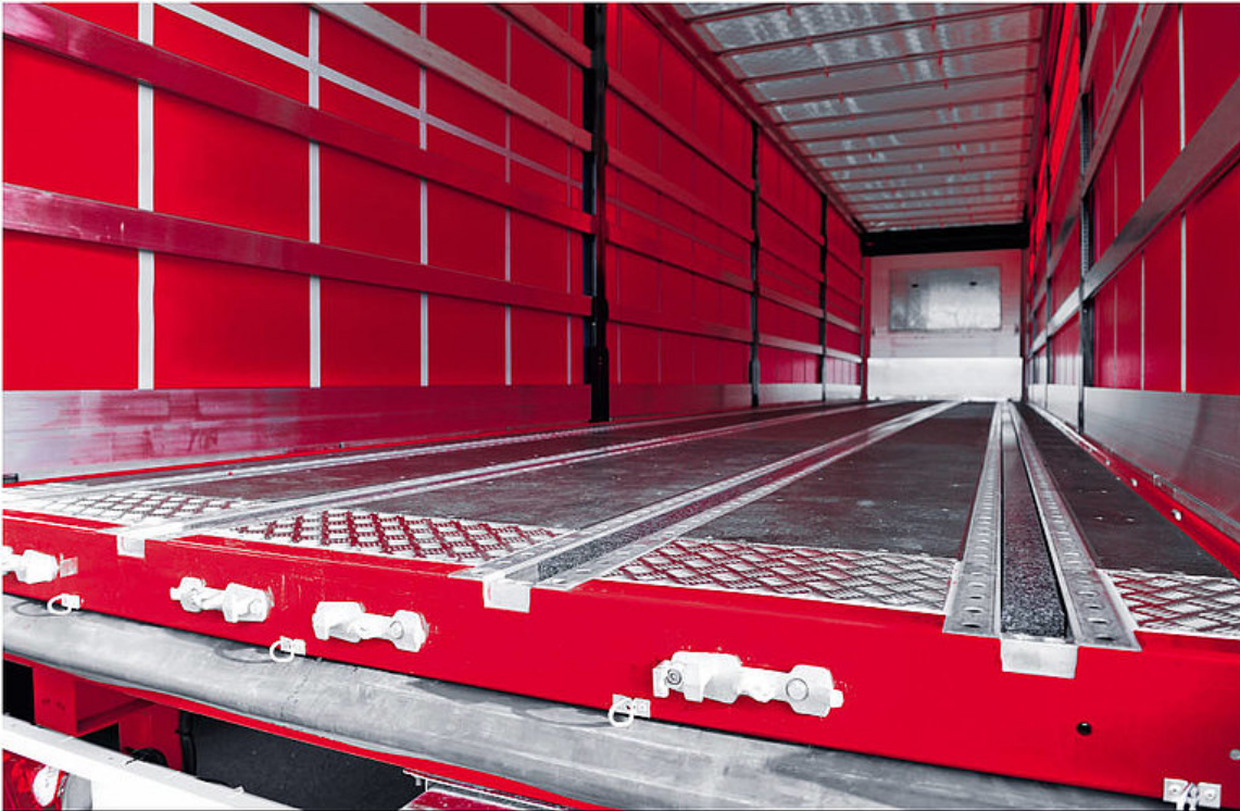
OPTIONAL: Einlagen für Joloda Schienen: Im General Cargo Einsatz werden die Schienen mit Kunststoff-Einlageprofilen abgedeckt bzw. aufgefüllt.