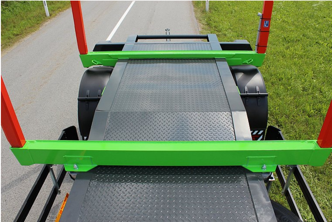
Stahltränenblech-Abdeckung zwischen den Rahmenlängsträgern