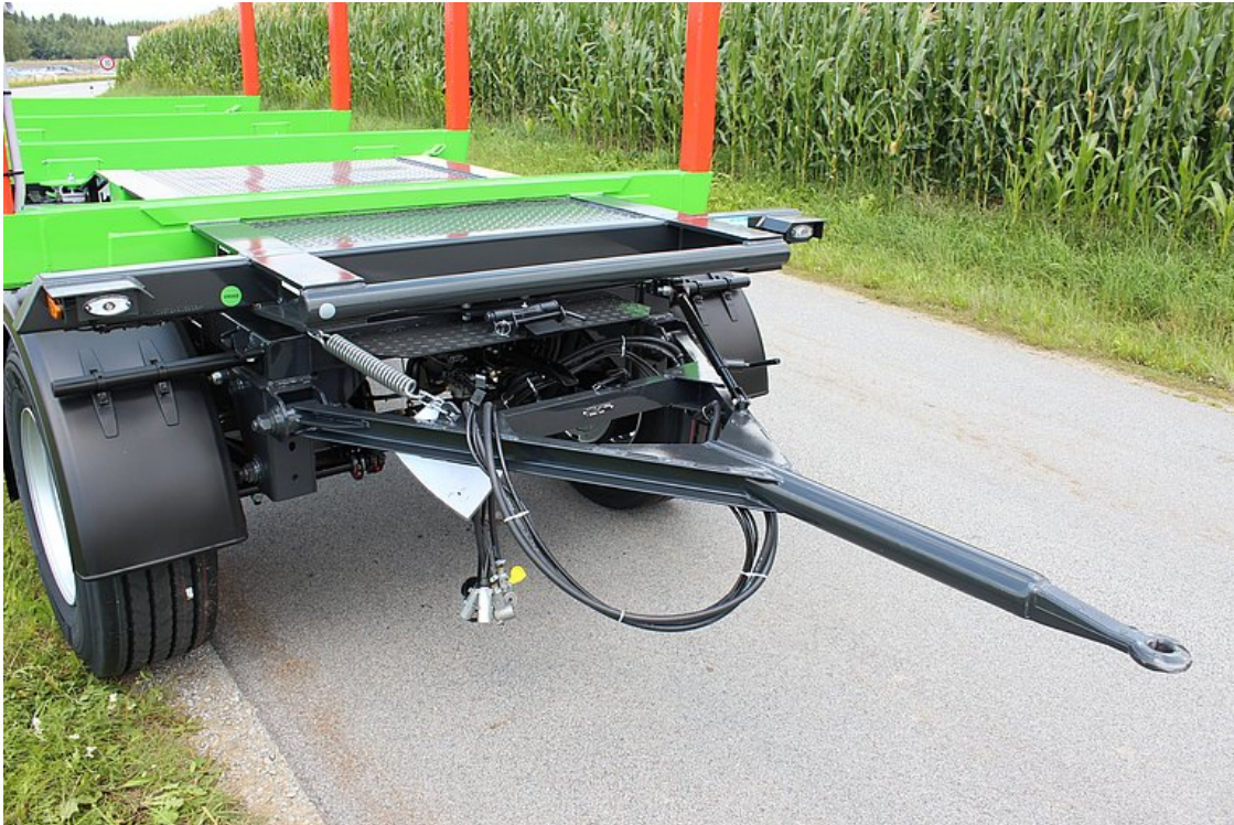
Vorne Drehgestell inkl. montierter Zuggabel