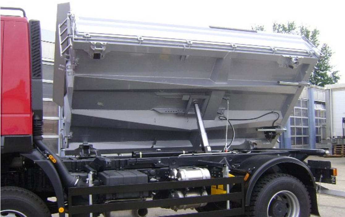
Konstrukce sklápěcí korby tvořená kónickými podélníky trapézového profilu ve vysokopevnostním lehkém provedení s malými podlahovými úseky pro vysokou odolnost proti bouřím a vysokou pružností tlumení nárazů