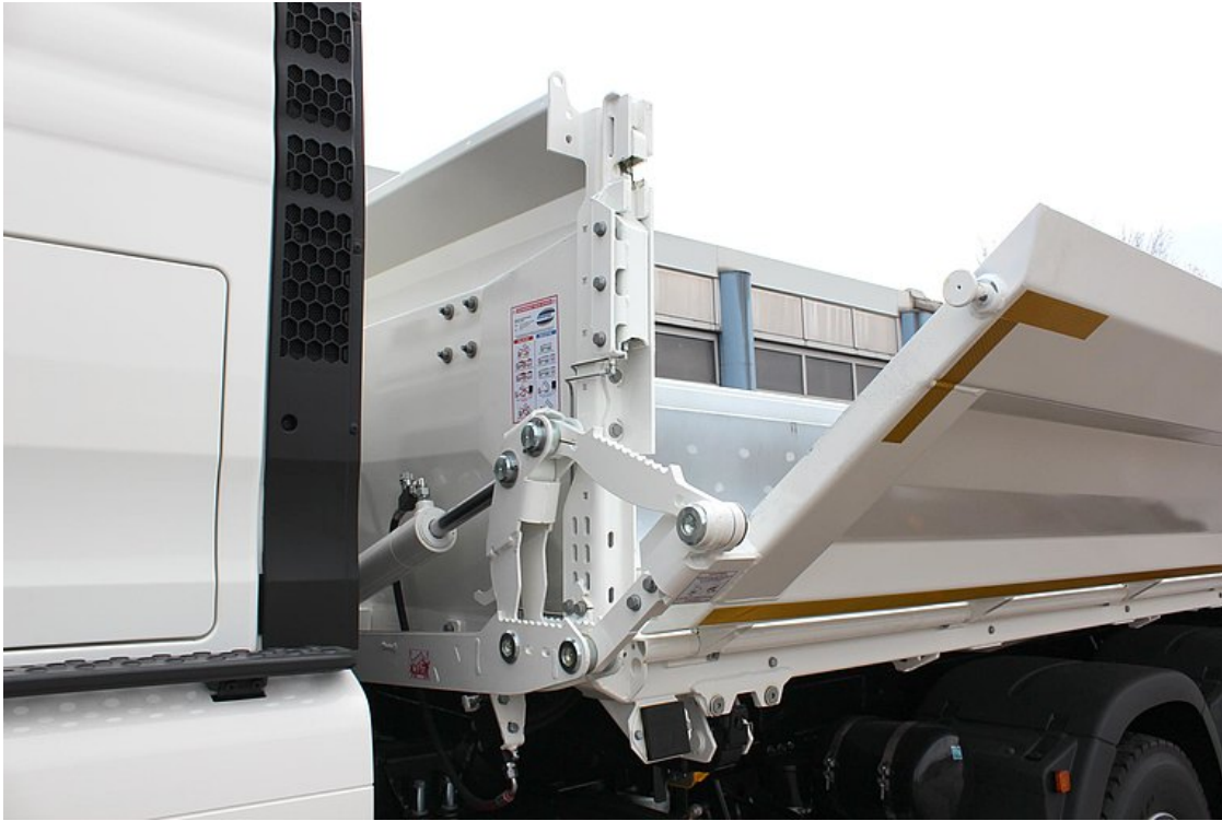
VOLITELNĚ: na levé straně Bordmatic = hydraulicky sklopná bočnice