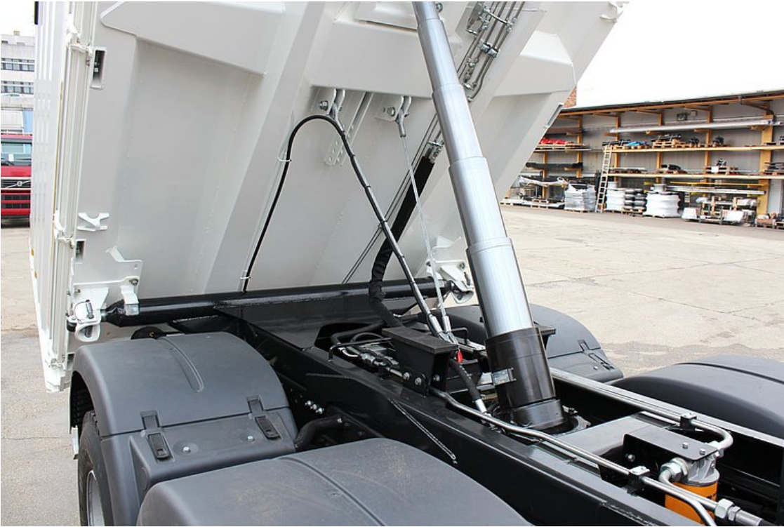
Tvrdě chromovaný, vysoce kvalitní hydraulický válec (hydromotor)