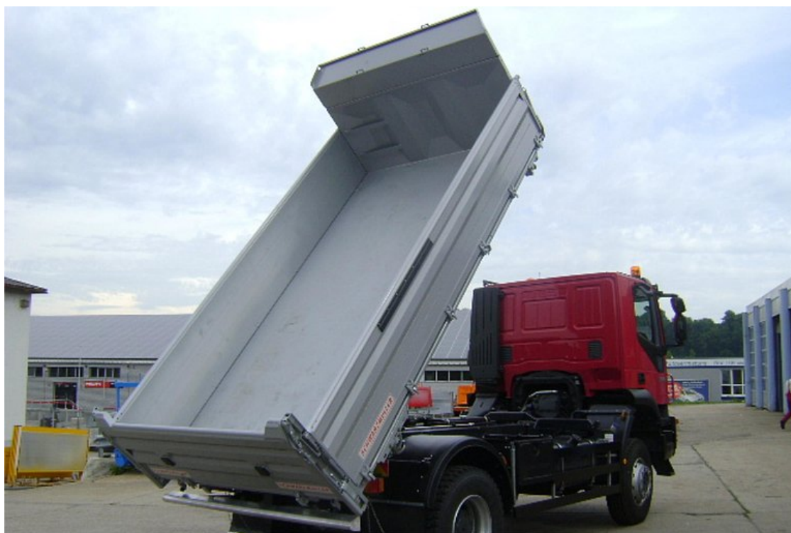
3-stranná sklápěcí nástavba na 2-nápravový podvozek - stavební provedení