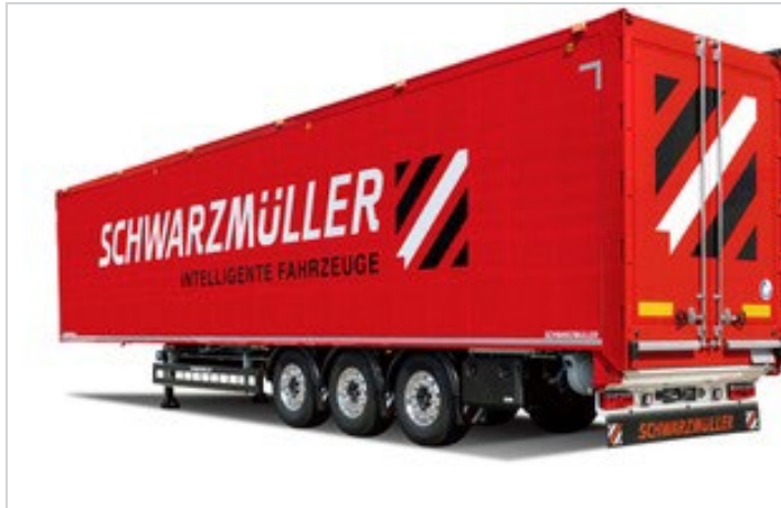
3-Achs Schubbodensattel mit Quick TOP Verdeck