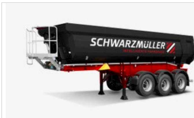
3-Achs Stahl- Segmentmulde

Ein elektronisches Bremssystem mit Stabilitätsprogramm, eine Liftachse als Anfahrhilfe, eine Mulde aus hochwertigem Verschleißstahl sowie ein vollelektrisches Schiebeverdeck mit Funkfernbedienung sind viele praxistaugliche und starke Argumente für die Schwarzmüller-Stahlmulde: Eine gute Wahl für den Transport von Sand, Erdaushub oder Schotter!