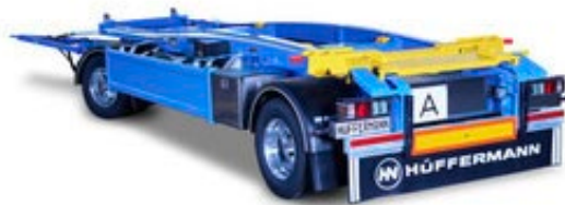
2-Achs Hüffermann Schlitten-Carrier

Hüffermann hat den Schlitten-Carrier einem umfassenden Redesign unterzogen, um die Anforderungen der Entsorgungsindustrie noch besser zu erfüllen. Mit den verbesserten Eigenschaften wird der Transport von Abrollbehältern mit einer Länge von fünf bis sieben Metern jetzt noch einfacher und sicherer bewältigt. Das gewichtsoptimierte, hochfeste Fahrgestell aus Feinkorn-Sonderstahl wurde speziell konstruiert, um den aufgesetzten Schlitten fast reibungslos zu verschieben. Die integrierten Rollenlager nehmen auch defekte und beschädigte Behälterrollen auf, was die Leistungsfähigkeit des Fahrzeugs unterstützt und den Transportprozess verbessert. Eine pneumatisch funktionierende 4-fach-Behälterverriegelung sorgt für eine einfache und bequeme Ladungssicherung. Die Wegfahrsperr verhindert das Wegfahren des Anhängers, solange die Verriegelung geöffnet ist, und erhöht somit die Sicherheit während des Transports. Der Schlitten-Carrier kann individuell ausgestattet werden, um spezifische Kundenanforderungen zu erfüllen und die Anhänger an unterschiedliche Einsatzbereiche anzupassen. Mit dem neuen, verbesserten Schlitten-Carrier präsentiert Hüffermann eine zuverlässige und flexible Transportlösung für die Entsorgungsindustrie. Die optimierte Konstruktion und die zahlreichen Ausstattungsmöglichkeiten machen den Anhänger zu einem unverzichtbaren Werkzeug für Ihr Unternehmen.