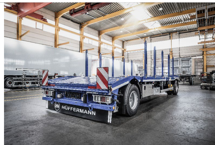
2-Achs Hüffermann Multi-Carrier