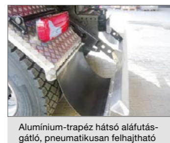
Alumínium-trapéz hátsó aláfutásgátló, pneumatikusan felhajtható