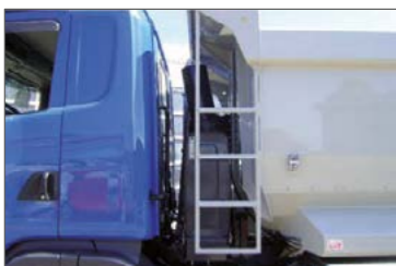
Alumínium létra elöl a puttonyon