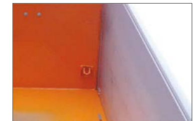
Oldalajtók belül 4 mm-es keményalumínium borítással