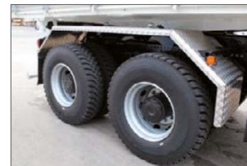
Cseppmintás alumínium lemez sárvédő a hátsó kerekek felett