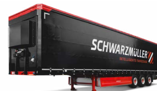
Platós járművek szállítványozás / távolsági fuvarozás, építőipar