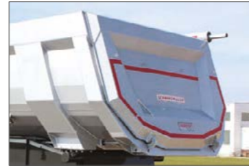
Kívülré záródó hátsó ajtó - ezáltal nagyobb raktérfogat