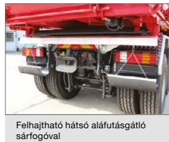
Felhajtható hátsó aláfutásgátló sárfogóval