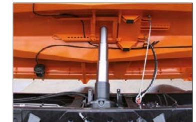
Középen elhelyezett munkahenger a 3-oldalra billentéshez