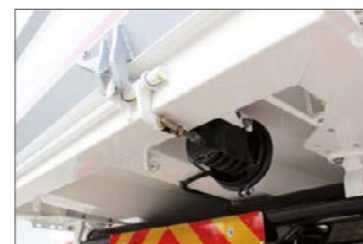
Pneumatikus zárszerkezet a hátsó ajtóhoz (a vezetőfülkéből működtethető)