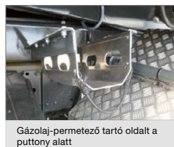
Gázolaj-permetező tartó oldalt a putnyon alatt