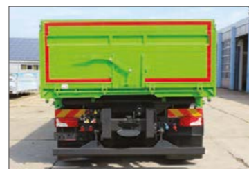
Hátsó ajtó üreges alumínium profilból, 400 x 400 mm-es gabonaablakkal