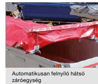
Automatikusan felnyíló hátsó záróegység

Elhúzható tető 300 mm magas tetőívvel, kézi- ill. elektromos működtetéssel. Műanyag ponyva, mindkét oldalon rögzítőkampók, hátul cikk-cakk lekötés