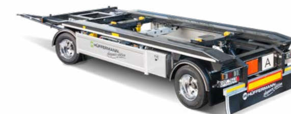
Görgős- ill. láncos konténer szállító járművek szemétszállítás