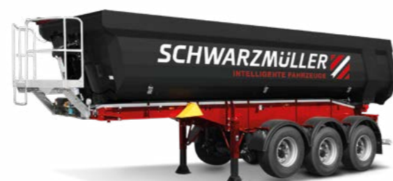
Billenőplatós járművek építőipar, mezőgazdaság, szemétszállítás