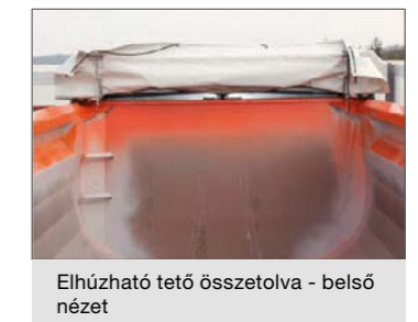
Elhúzható tető összetolva - belső nézet