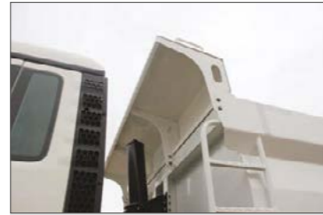
Mellfal magasított fülkevédővel, létrával