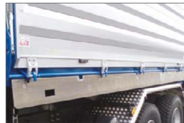
Alumínium terelőlemez a zártengelyen