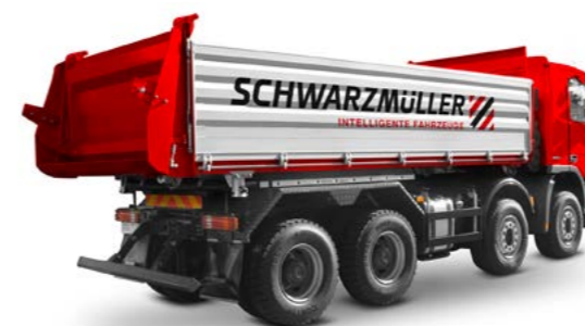
Járműfelépítmények építőipar, szállítványozás / távolsági fuvarozás, szemétszállítás