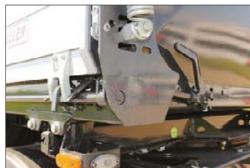
Mechanikus, központi ajtózárs az oldalfalnál