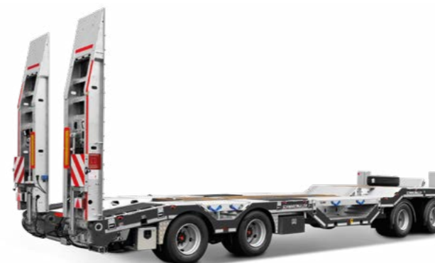
Nehézgépszállító járművek építőipar