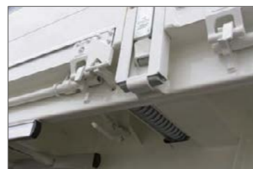
Emeléssegély a puttony alatt az oldalajtók könnyebb lenyithatóságához