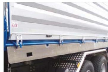
Alumínium tereelőlemez a zártengelyen