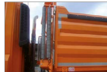
Erősített, dupla rugós emelésrészegítő az oldalfalhoz