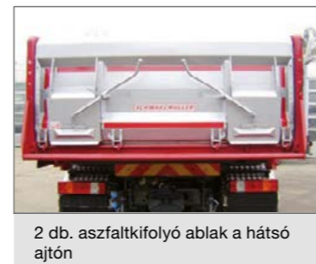
2 db. aszfaltkifolyó ablak a hátsó ajtón