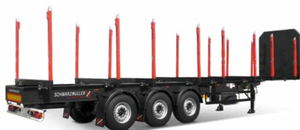
Rönkszállító járművek faipar

nek, tudásának és szakértelmének az eredménye - ezáltal tudunk minden szállítási ágazatnak személyre szabott megoldást kínálni. Minden Schwarz Müller jármű a kompromisszumok nélküli prémium minőség megtestesítője, ami a napi használatban nagyon komoly hozzáadott értéket képvisel.