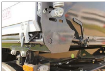
Mechanikus, központi ajtózárs az oldalfalnál