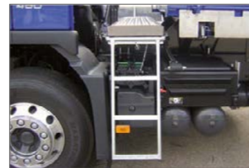
Kihúzható fellépő elöl a puttony és a vezetőfülke között