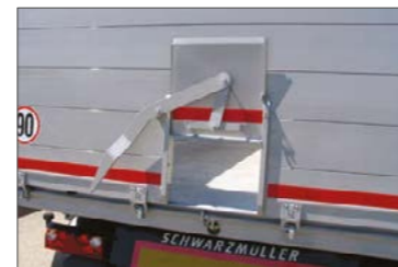
Gabonaablak a hátsó ajtóban