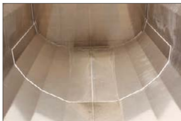
Alumínium koptatólemez a puttony hátsó részén