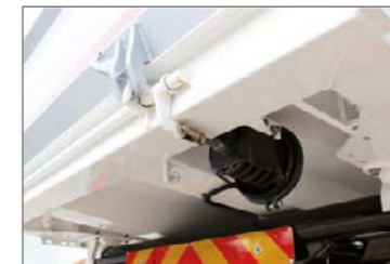
Pneumatikus zárszerkezet a hátsó ajtóhoz (a vezetőfülkéből működtethető)