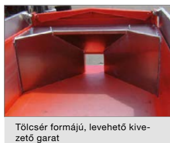
Tölcsér formájú, levehető kivezető garat