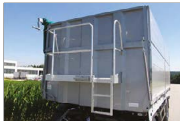
Kezelőkarzat a mellfalon