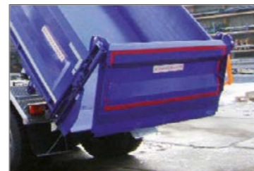
Pneumatikus működtetésű hátsó ajtó