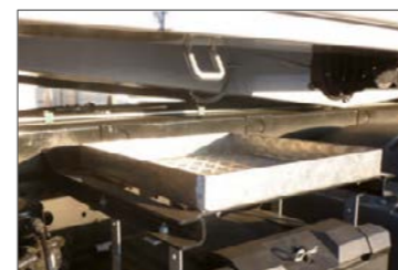
Alumínium csepptálca oldalt a puttony alatt