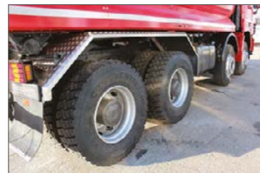
Cseppmintás alumínium lemez sárvédő a hátsó kerekek felett