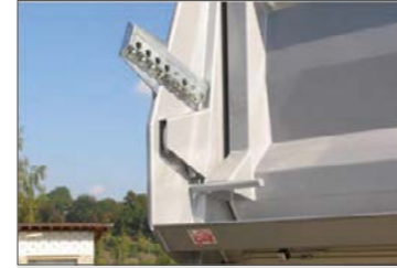
Adagolóberendezés lengő kivitelű hátsó ajtóhoz, rögzítőcsappal