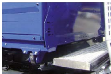
Kezelőkarzat elöl a puttony és a vezetőfülke között