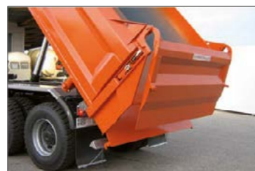
Hidraulikusan működtetett hátsó ajtó, kettős működésű munkahengerral