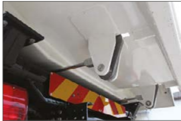
Automatikus, mechanikus hátsóajtó zárszerkezet