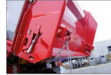
Kampó a hátsó ajtón az adagoló-láncnak