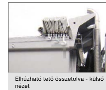
Elhúzható tető összetolva - külső nézet