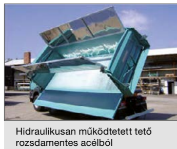
Hidraulikusan működtetett tető rozsdamentes acélból