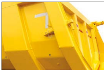
Adagolóberendezés a lengő kivitelű hátsó ajtóhoz, kihúzható ütközővel