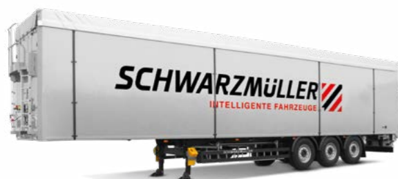
Mozgópadlós járművek szállítványozás / távolsági fuvarozás, faipar, szemétszállítás