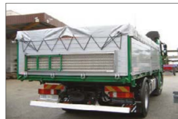
Lehajtható kezelőkarzat hátul