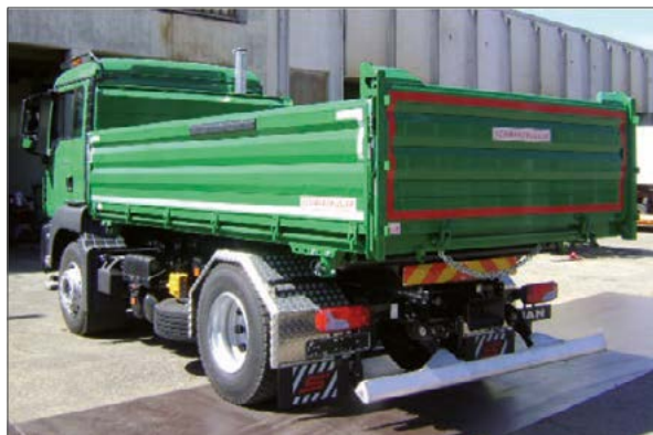
3-Seiten-Kippaufbau auf 2-Achs-LKW – Baustelle