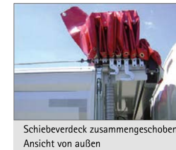
Schieberverdeck zusammengesoben - Ansicht von außen