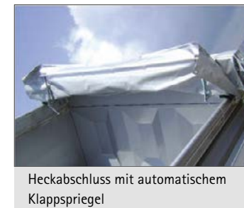
Heckabschluss mit automatischem Klappspriegel

Schieberverdeck, mit 300 mm Bogenhöhe, wahlweise manuelle oder elektrische Betätigung, samt Kunststoff-Plane und beidseitig Verriegelungshaken, sowie hinten Zick-Zack-Verschnürung