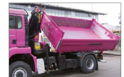
Kippaufbau mit Frontkran

Stand: März 2013 · Technische Änderungen vorbehalten