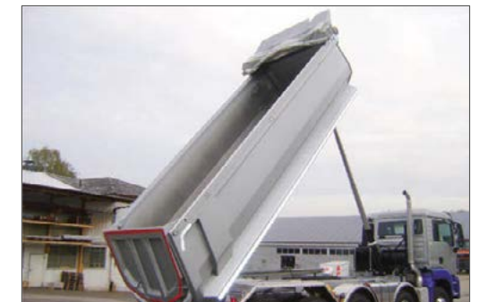
Schieberverdeck, mit 300 mm Bogenhöhe, wahlweise manuelle oder elektrische Betätigung, samt Kunststoff-Plane und beidseitig Verriegelungshaken, sowie hinten Zick-Zack-Verschnürung