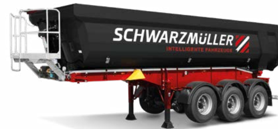
Kippfahrzeuge Bauwirtschaft, Landwirtschaft, Entsorgung