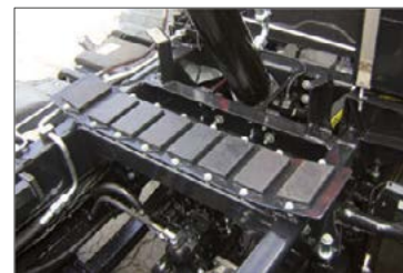
Gummiunterlagen für ein sauberes und exaktes Aufliegen der Mulde