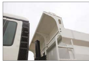
Vorderwand oben mit erhöhtem Baggerschutz, sowie mit Aufstiegleiter