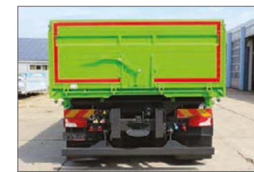
Aluminium-Hohlprofil-Rückwand, mit Getreideschuber ca. 400/400 mm