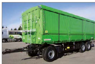
Fernverkehrs-Kippanhänger mit Rolldach und Seitenplanen