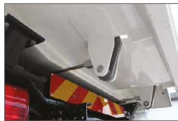
Automatische, mechanische Rückwandverriegelung