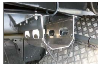
Dieselspritzenhalterung seitlich unter der Kipperbrücke