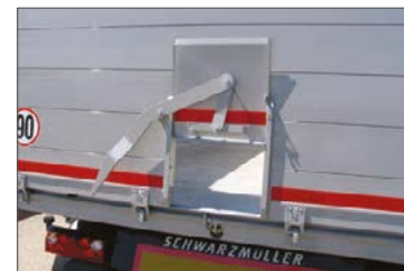
Heckseitig in der Rückwand mit Getreideschuber