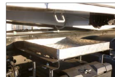
Aluminium-Ablagewanne seitlich unter der Kipperbrücke