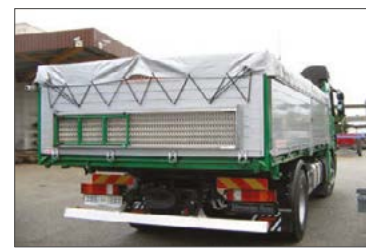
Heckseitig ein klappbares Stehpodest