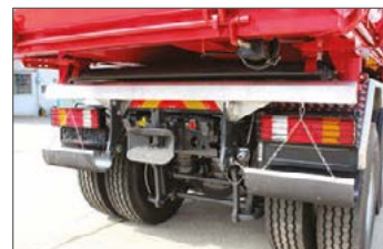
Unterfahrerschutz inkl. Schmutzfänger hochklappbar