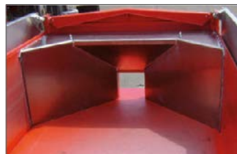
Trichterförmiger, abnehmbarer Auslaufkeil