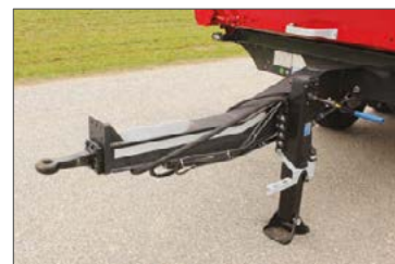
Zugstange gekröpft mit höhenverstellbarer Öse (Zentralachs-Kippanhänger)