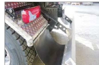
Aluminium-Trapez-Unterfahrerschutz pneumatisch hochklappbar