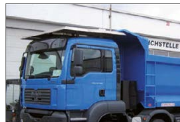
Vorne oben mit Abdeckung für das Fahrerhaus