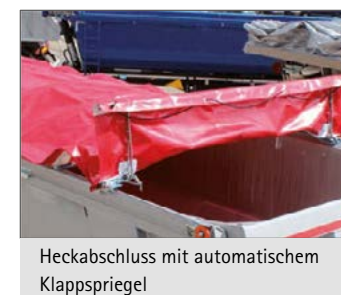
Heckabschluss mit automatischem Klappspriegel