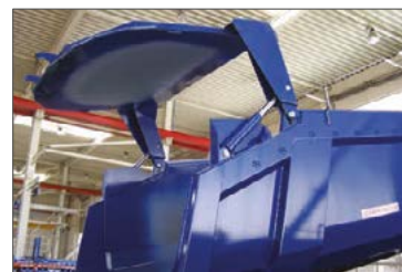
Sonder-Pendelrückwand für extrahohe Öffnung mit autom. Hydraulikbetätigung