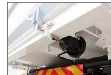
Pneum. Rückwand-Verriegelung vom Fahrerhaus zu öffnen