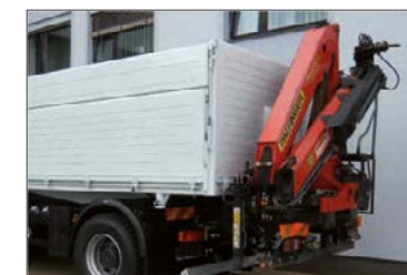
Fernverkehrs-Kippaufbau mit Heckkran