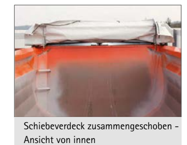
Schieberverdeck zusammengeschoben – Ansicht von innen