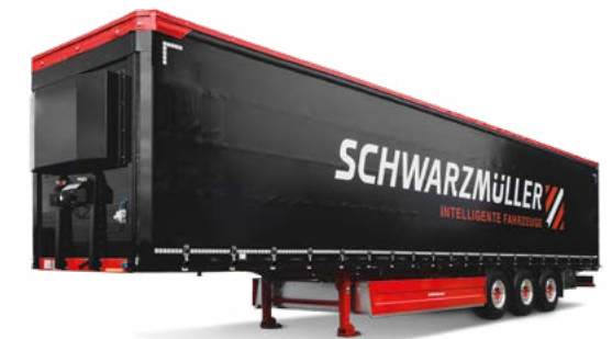
Plateaufahrzeuge Spedition/Fernverkehr, Bauwirtschaft