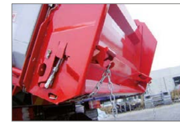
Haken an der Rückwand zum einhängen der Dosierketten