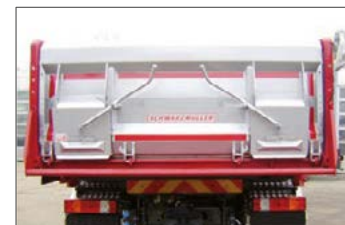
Mit zwei Asphaltschieber in der Rückwand