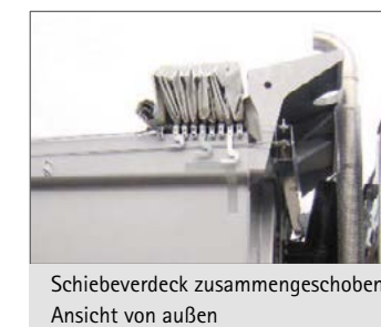
Schieberverdeck zusammengeschoben – Ansicht von außen