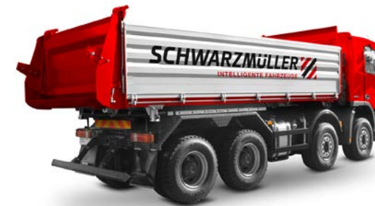
Aufbaufahrzeuge Bauwirtschaft, Spedition/Fernverkehr, Entsorgung