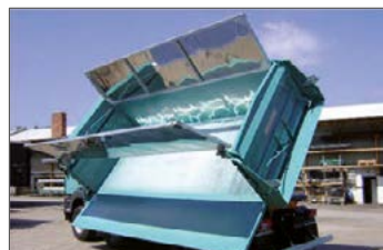
Hydraulische Mischgutabdeckung aus Edelstahlblech

3-Seiten-Kippaufbau auf 2-Achs -LKW – Fernverkehr, mit heckseitiger Halterung für Förderband