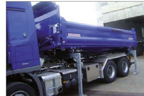
3-Seiten-Kippaufbau mit Abrollkipper-Wechselsystem auf 3-Achs-LKW