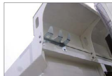
Schaufel- und Besenhalterung vorne an der Mulde