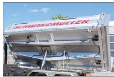
Kipperbrücke in Hohlkammer-Bauweise