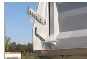
Dosiereinrichtung für Pendel-Rückwand mit Vorsteckbolzen