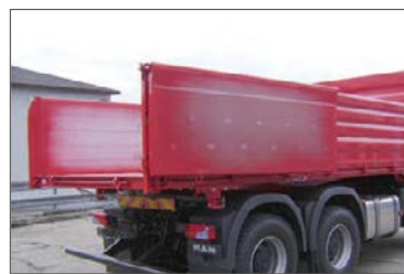
Rückwand zusätzlich als Türflügel ausschwenkbar