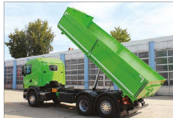
3-Seiten-Kippaufbau auf 3-Achs-LKW – Fernverkehr