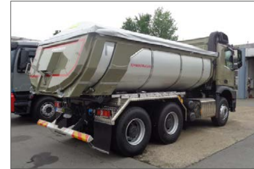
Thermomulden-Kippaufbau auf 3-Achs-LKW