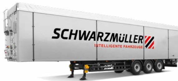
Schubbodenfahrzeuge Spedition/Fernverkehr, Holz, Entsorgung