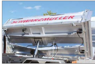
Kipperbrücke in Hohlkammer-Bauweise