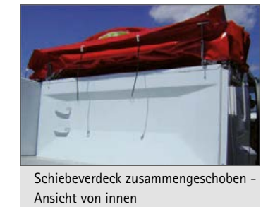
Schieberverdeck zusammengesoben - Ansicht von innen