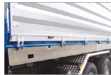
Aluminium-Schüttleiste auf Zentralverriegelungswelle