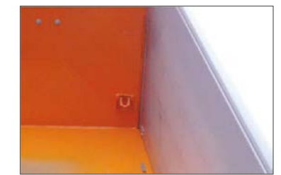
Seitenwände mit Hartaluminium-Innenverkleidung 4 mm