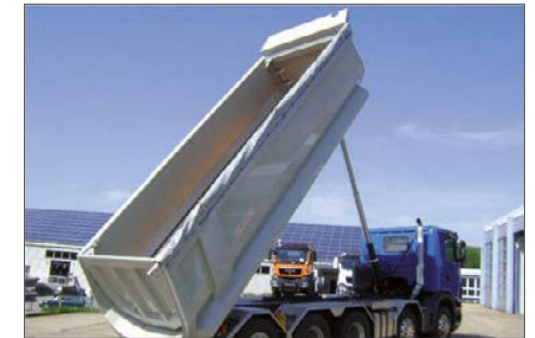
Kunststoff-Rollplane inkl. Aluminium-Rohr samt Handkurbel; linksseitig mit 2 Spanngurte sowie Spannschlösser auf Muldenunterseite; rechtsseitig waagrechte Planenbügel-Seilverschnürung