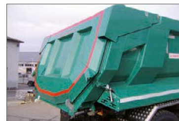
Außenliegende und schlammichte Rückwand