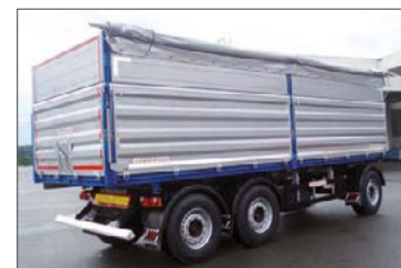
Baustellen-Kippanhänger mit Rollplane und Aufsatzwände