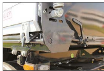
Mechanische Zentralverriegelung der Seitenwände