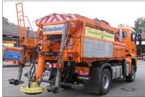
3-Seiten-Kippaufbau auf 2-Achs-LKW – Baustelle, für den kommunalen Bereich