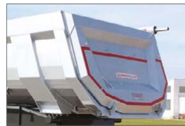
Außenliegende Rückwand – dadurch mehr Ladevolumen