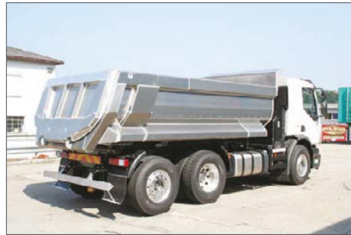
Aluminium-Segmentmulden-Kippaufbau auf 3-Achs-LKW