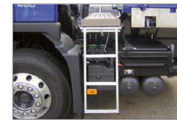
Ausziehbare Aufstiegleiter vorne zwischen Brücke und Fahrerhaus